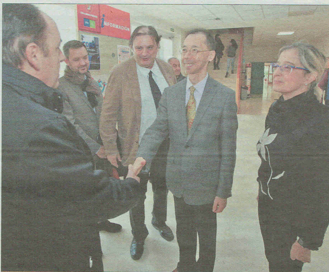
El ministro de Cultura de la embajada de Japón en España, Toru Shimizu, saluda a las autoridades. MARIO TEJEDOR

Shimizu mostró su voluntad de que iniciativas como el curso clausurado ayer sirvan para «estrechar nuestros lazos» y aseguró que desde la embajada se desea que «venga a esta tierra el mayor número de japoneses».